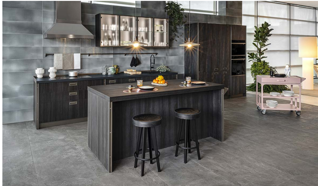
Diesel Get Together Kitchen by Scavolini & Diesel Living

“La più amata dagli italiani” ha da tempo un’anima rock. A dimostrarlo la proficua collaborazione tra Scavolini e Diesel Living costellata di successi, dopo aver individuato le esigenze di un fruitore che è cittadino del mondo. Anche questa volta, i più recenti progetti di cucina e bagno si fanno portavoce di uno stile di vita inclusivo, friendly e informale, attento ai dettagli.